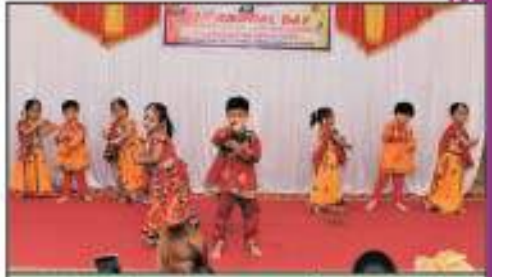
શાઈનીંગ સ્ટાર્સ પાઠશાળાનાં ભુલકાઓ દ્વારા સુંદર સાંસ્કૃતિક કાર્યક્રમની પ્રસ્તુતિ