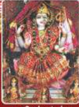
॥ શ્રી અંબઈ માં ॥